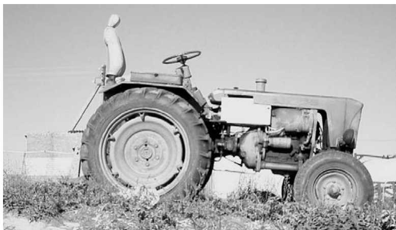
Пятницкий «раритет». И ведь работает!

Немного обидно становится, ведь мы должны, а главное можем сделать так и у себя. Очень надеюсь, что происходящий поворот власти к селу, его проблемам – это не временное явление, а начало системной работы в агропроме.